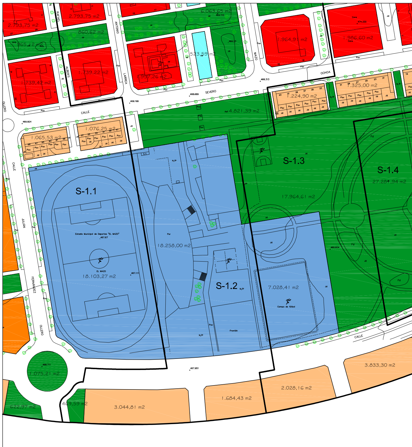
MODIFICACION PUNTUAL DEL PLAN PARCIAL DE LOS SECTORES S-1.1, S-1.2, S-1.3 Y S-1.4 DE HARO 4. ORDENACION. Propuesta. Escala 1/2000